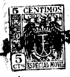
FIG. 1 48546-