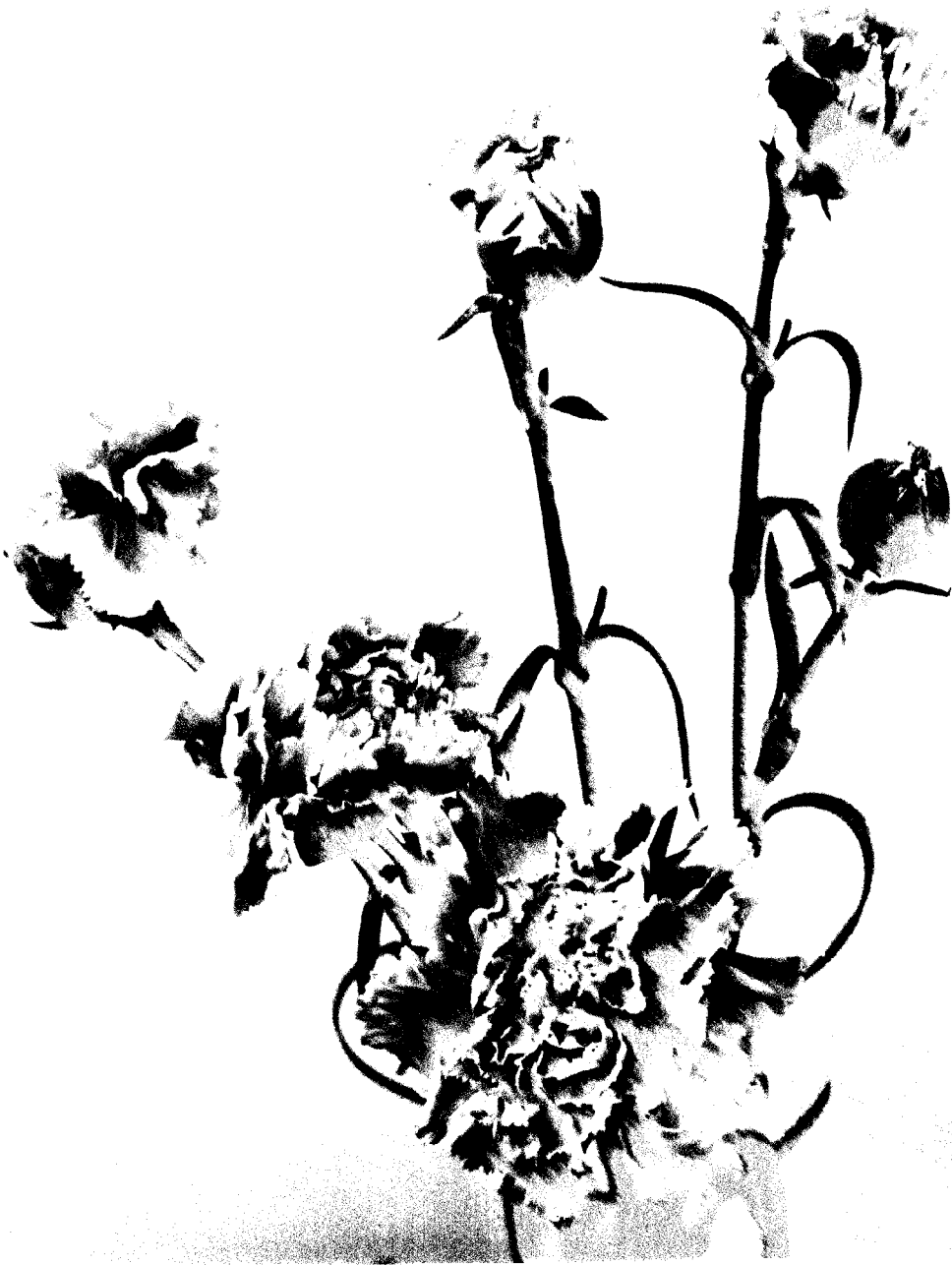
[Faint, illegible text, likely a botanical description]