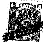
FIG. 1. a