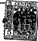
FIG. 1 40236