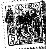
Figura nº 1.