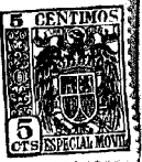
Fig. 1ª 87952