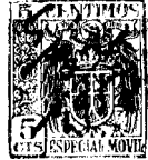
Fig. - 1