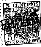
Fig. 1 847 27