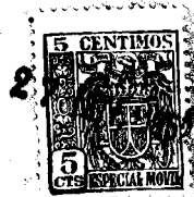
Fig Nº 1