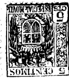
Fig = A