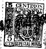
FIG. 1. a