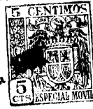
FIG. P 2137