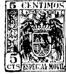
Fig. 2 a