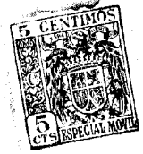
Fig. 1 31489