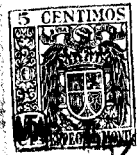
Fig. 1 39927