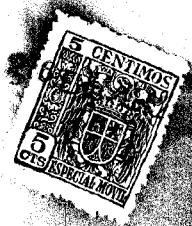
Figura n.º 2.