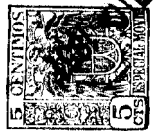
Fig. 1 a