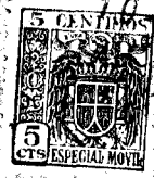
FIG. 1. a