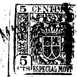
Fig. - 1