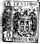
FIG. 1. a