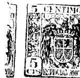
Fig. 1. a