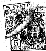
Fig. 1 23195