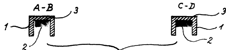
Fig. 3 o