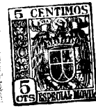
Fig. 1 21883