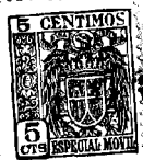
Fig 1 a