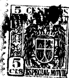
20246 FIG. 1