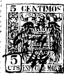
Fig. 1. 19646