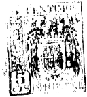
Figura n° 1.