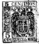
Fig. 1 a 16275