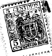
Fig. 1 a