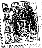
Fig. 1. a 15678