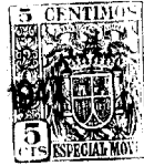
Fig. 1º 31 JUL.