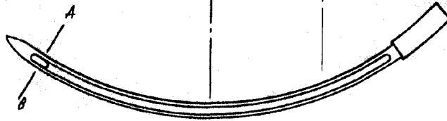
FIGURA N.º 1