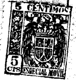
FIG. 1. a